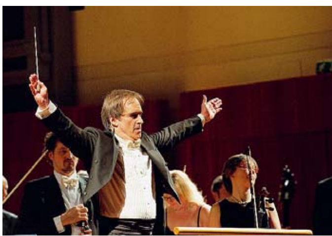
Ricordando Toscanini James Conlon al Paganini.

Occasione rilevante dunque, richiamata dalla ricorrenza toscaniniana che Conlon ha voluto onorare con una pagina di sottile fascino - l'ombra dell'«Adagietto» mahleriano in filigrana - come l'«Adagio» per archi che il Maestro aveva chiesto a Samuel Barber. Più ampio e originale il profilo del programma che muoveva da un contesto che Conlon è andato da anni esplorando con appassionata determinazione quale quello