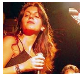
Musiche Maria Teresa Lonetti.

Spiega una nota: «L'entroterra calabrese è da sempre legato a storie suggestive, come quella che lo vuole luogo in cui le streghe si rifugiavano